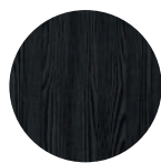
Fresno negro Black Ash